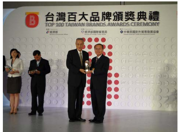
由行政院 吳敦義院長頒發台灣百大品牌獎座