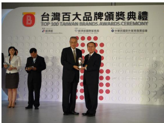
由行政院 吳敦義院長頒發台灣百大品牌獎