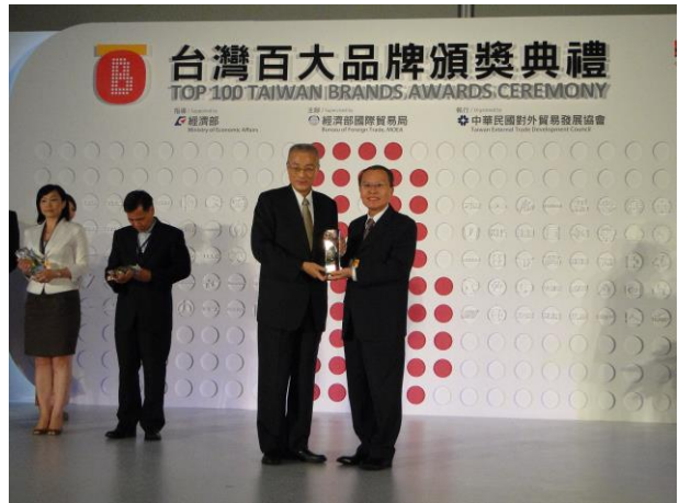
由行政院 吳敦義院長頒發台灣百大品牌獎座